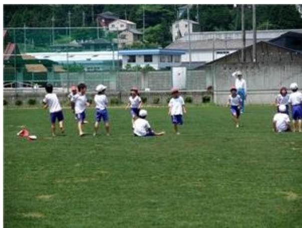
県民まちなみ緑化事業による校庭の緑化

◆お申込先：但馬県民局駐在緑のパトロール隊 但馬県民局豊岡土木事務所まちづくり建築第1課内 〒668-0025 豊岡市幸町 7-11 TEL 0796-26-3757 FAX 0796-24-5593