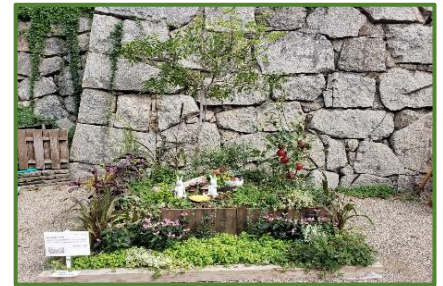
「2022ガーデンコンペ・ひょうご」 C部門 兵庫県知事賞受賞作品

学校や会社の園芸活動グループや自治会、老人会など 花緑団体の皆さんに、草花や樹木等を使用して規格に適合 するガーデンを作庭していただきます。